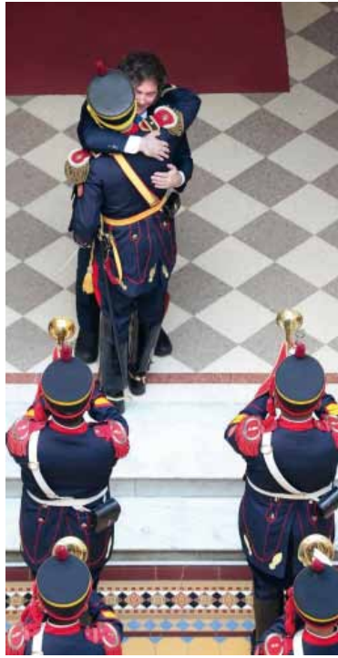
En San Lorenzo. Milei participará de la ceremonia