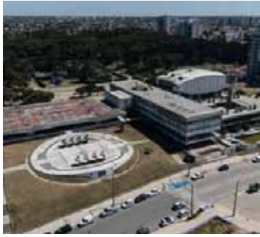
El Complejo del Casino necochense

Se suspendió la subasta del Casino de Necochea