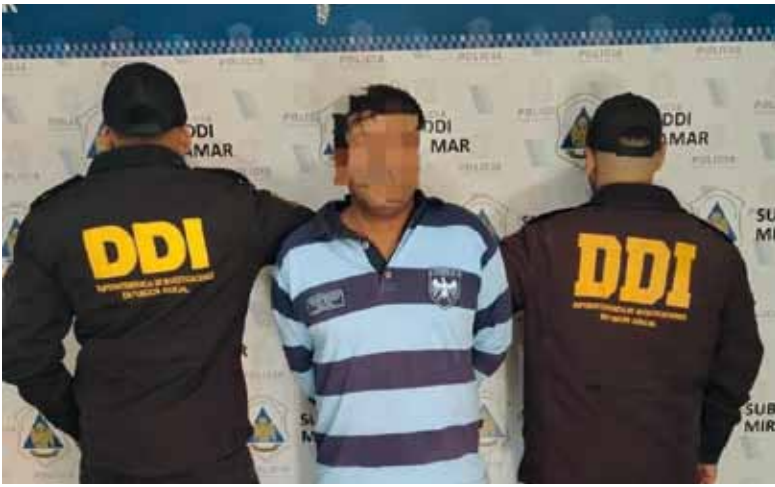
Capturado. El sospechoso de violar a una adolescente en enero

Un hombre de 40 años fue detenido este viernes en Miramar, acusado de ser el presunto autor material de un abuso sexual de una adolescente de 16 años cometido a fines de enero en una playa de esa ciudad. La detención se concretó tras una serie de tareas investigativas desarrolladas por personal de la SubDDI Miramar, por disposición de la Fiscalía Descentralizada local. El hecho que dio origen a la investigación ocurrió el 29 de enero, alrededor de las 5.10 de la madrugada. En ese momento una pareja de adolescentes se encontraba en la playa ubicada en la intersección de calle 33 y la Costanera, donde habían ido a ver el amanecer sobre el mar. Amenaza y abuso Según la denuncia, los chicos fueron abordados por un sujeto que las amenazó con un arma blanca. El agresor ató los pies de las víctimas y, bajo amenazas, las obligó a despojarse parcialmente de sus prendas. Allí, violó a la joven. Gracias a la intervención del otro adolescente, lograron zafar del atacante y huir del lugar. Durante la fuga, el agresor también les sustrajo los teléfonos celulares