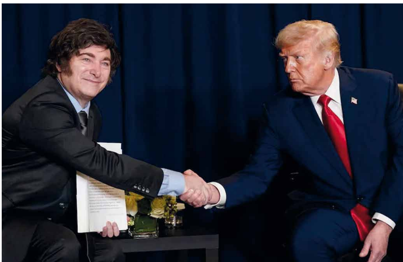
■ Histórico acuerdo con Estados Unidos por la exportación de carne