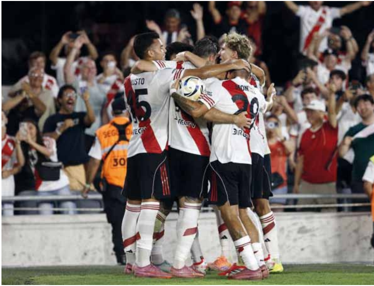
Va por la punta. El "Millonario" busca el liderazgo.

Para este compromiso, Gallardo deberá realizar al menos una modificación obligada. Sebastián Driussi sufrió un desgarro en el isquiotibial izquierdo que lo marginará de las canchas durante aproximadamente tres semanas, por lo que Maximiliano Salas aparece como principal opción para ocupar su lugar en el frente de ataque.