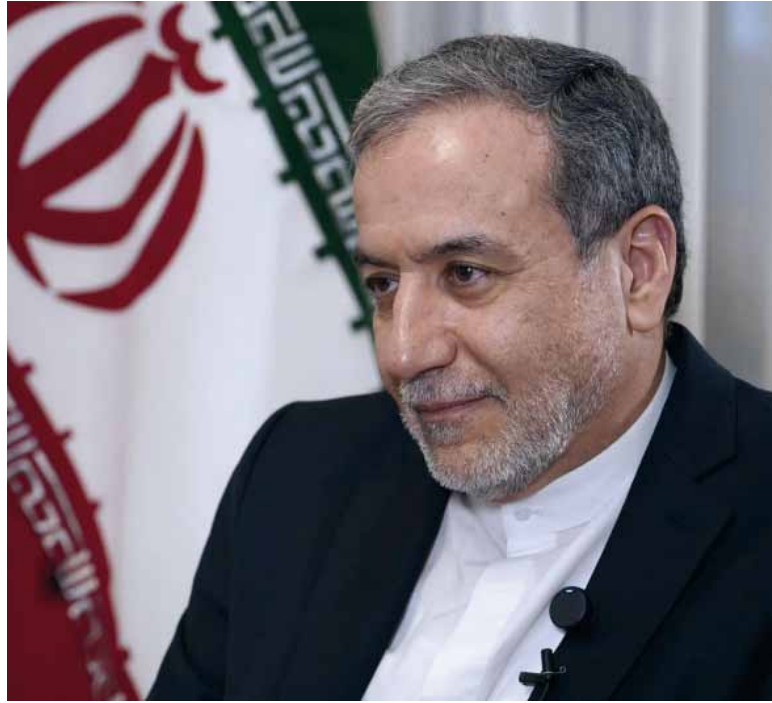
El ministro. De Asuntos Exteriores iraní, Seyed Abbas Araghchi

Tras las conversaciones, Al Busaidi, ministro de Asuntos Exteriores omaní, publicó un comunicado en la red social X, calificándolas de "muy serias" y "útiles". Ayudaron a aclarar la postura de cada parte e identificar posibles áreas de progreso, afirmó, y añadió que las partes