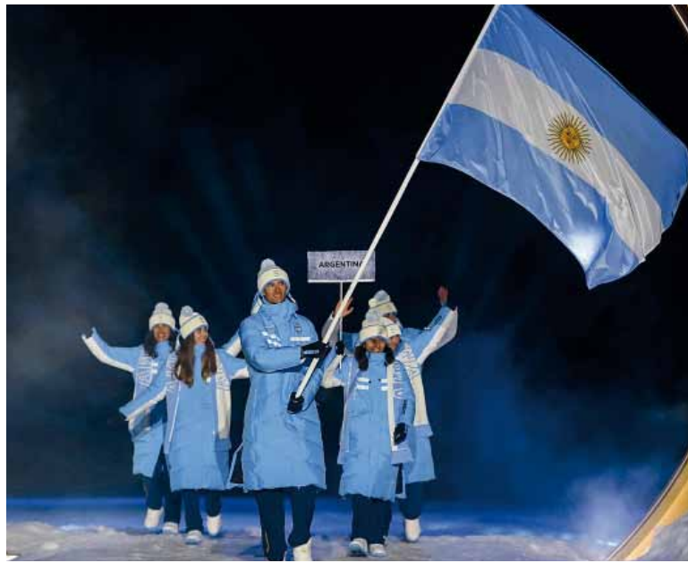
Orgullo. Franco portó la insignia argentina en el estadio San Siro de Milán.

Vaya que es difícil: no solo que Argentina no tiene medallas en los Juegos Olímpicos de Invierno, desde aquellos primeros Juegos de Chamonix (Francia) en 1924, sino que ningún país latinoamericano se subió jamás a un podio. A la cabeza del ranking está Noruega, se-