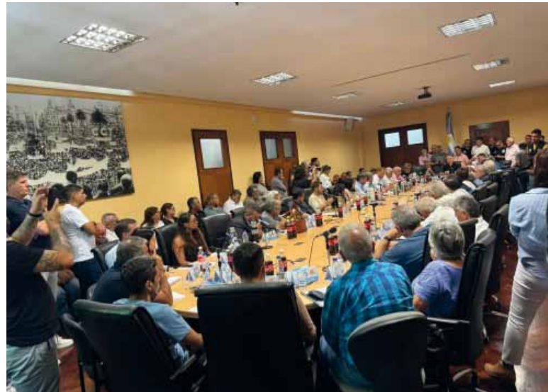
Reunión. Se decidió marchar, pero evitar el paro

Otra acción que tendrá lugar el próximo miércoles serán concentraciones frente a las sedes de las casa de gobierno de diferentes provincias, según resaltó Solá, "para demostrar también