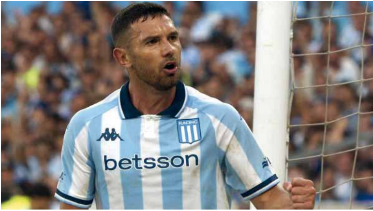
Es tiempo. La "Academia" necesita los goles de "Maravilla" Martínez.

Será desde las 18 en Avellaneda, por la cuarta fecha del Grupo B del Torneo Apertura. El árbitro será Mastrángelo y Delfino estará a cargo del VAR.