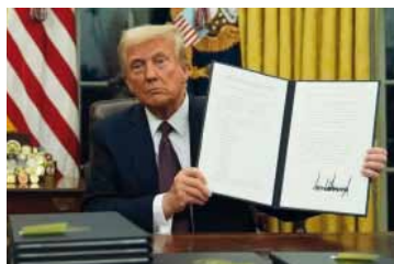
Test. Pacto comercial. El presidente de EEUU, Donald Trump.

El texto del acuerdo comercial fue difundido el jueves por la Oficina del Representante Comercial de Estados Unidos (USTR, por sus siglas en inglés) e incluye ese aumento de la cuota para la carne argentina es por este año.