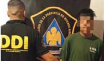
El conductor tiene 19 años

munes, buscando dinero, objetos de valor y cualquier elemento que pudiera ser fácilmente trasladado. A pesar de la violencia del hecho, ninguna de las personas resultó herida. Huida Tras concretar el robo, los cinco sospechosos escaparon del lugar con pertenencias, sin que hasta el momento se haya precisado oficialmente el botín sustraído. Tomó intervención la Unidad Funcional de Instrucción N°5 de Lanús, que dispuso las primeras medidas judiciales y ordenó avanzar con la investigación bajo la carátula “robo agravado”. - DIB -